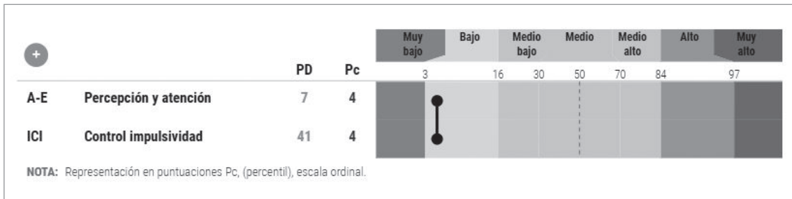
Figura 4.3. Perfil de resultados del caso ilustrativo 2 (alumno de 5.º de Primaria)

El rendimiento de la persona es muy bajo (A-E, Pc = 4) con respecto a su grupo de edad, al igual que su control de la impulsividad (ICI, Pc = 4). Los percentiles reflejan que tanto su rendimiento como su control de la impulsividad es inferior al del 96% de los niños/as de su edad. Su ejecución no parece lenta, sino principalmente impulsiva y errática, realizando juicios poco reflexivos o respondiendo al azar.